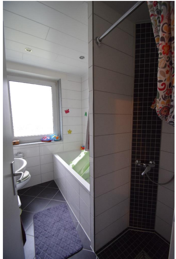
Badezimmer mit Dusche und Wanne